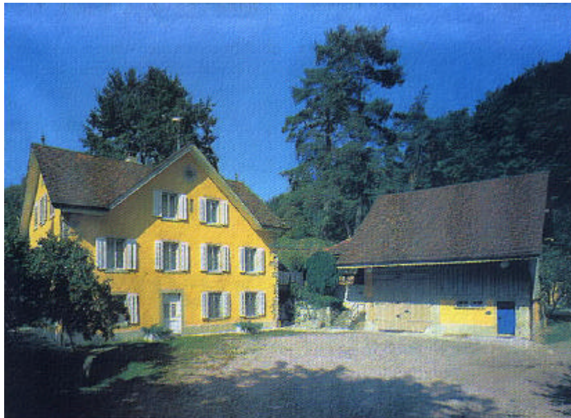
Teilansicht des Emma-Kunz-Zentrums