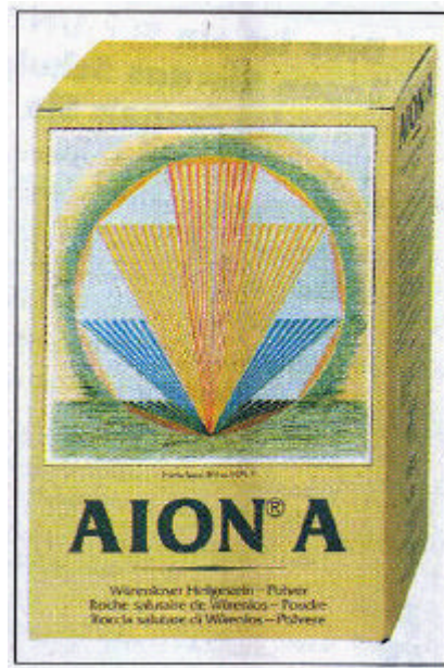
Das Würenloser Heilgestein Aion A

Die starke antiödematöse Wirkung von AION A findet hervorragende Anwendungsmöglichkeiten in Verbindung mit Lymphdrainage. Nähere Auskünfte und Informationen erhalten Sie direkt bei der Herstellerin: